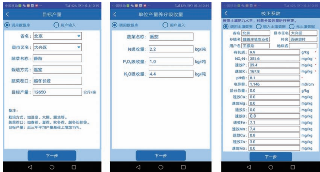
图 2 蔬菜施肥量简便快速推荐系统 APP 推荐信息输入

在对智能手机用户和手机市场调研的基础上，产品开发最终选用了 Android、iOS 操作系统智能手机。推荐系统所有数据均来自于国家大宗蔬菜产业技术体系养管理岗位经费项目、国家重点研发计划课题“设施蔬菜化肥减施关键技术优化”等研究中获得的数据以及与各地土壤肥料研究所、土壤肥料工作站等交换数据。数据库采用 Excel 2003 构建。系统开发采用 C#、Java 语言。图 2、图 3 为智能客户端安装在基于 Android 操作系统的国内某知名手机品牌上的实际情况，其中图 2 为推荐信息输入界面，图 3 为推荐结果输出界面。