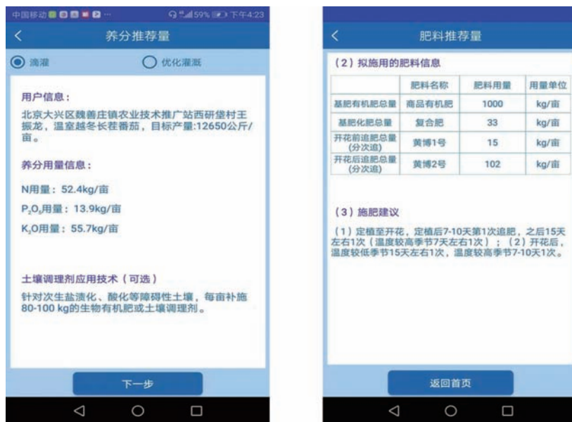
图3 蔬菜施肥量简便快速推荐系统 APP 推荐结果输出

基于移动通讯技术的蔬菜施肥量简便快速推荐系统在河北省定兴县、藁城区、永清县、青县以及天津市西青区、武清区等设施蔬菜优势区核心示范基地应用，示范效果显著，减施化肥养分30%，增产8%以上，增收15%以上。智能手机客户端通过网络访问并调用数据中心的专家推荐施肥数据库，仅消耗网络流量，应用表明，完成一次施肥推荐仅需要0.1~0.2 M的流量，在河北省5元购买30 M网络流量的模式下，仅需要0.02元。