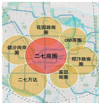
图 1 郑州市新生代农民工留城意愿调研地